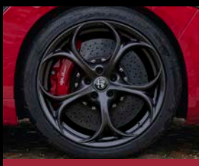
19" kola z lehkých slitin QV Classico (3DB) – standard