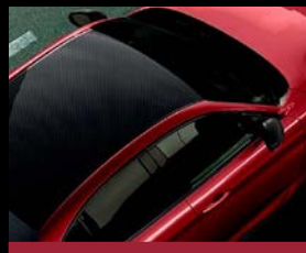
Karbonová střecha bez lakování (4GS)