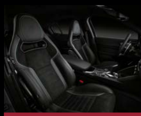
Karbonová sedadla Sparco (60A)