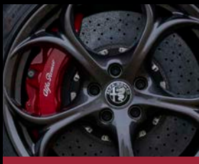
Karbon-keramické brzdy (BRM) *červené lakování třmenů lze objednat i na standardní brzdový systém