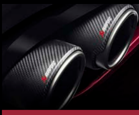
Titanový výfukový systém Akrapovič (NEC)