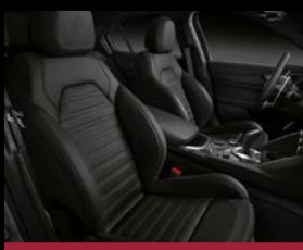
Sportovní kožená sedadla (788) – standard