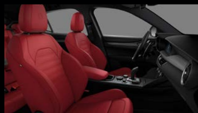
Sportovní perforovaná sedadla v červené kůži (Sprint a Veloce 557)