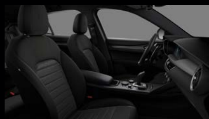
Komfortní sedadla v černé látce (Sprint 030)