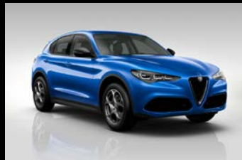
Modrá Misano (5DS-756)