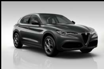
Šedá Vesuvio (5CE-035)