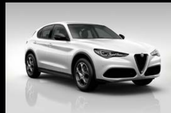
Bílá Alfa (2H6-240)