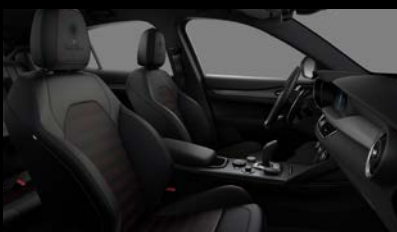
Sportovní perforovaná sedadla v černé kůži s červeným prošíváním a podkresem (Tributo Italiano 646)