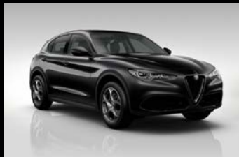
Černá Vulcano (58B-408)