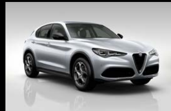
Šedá Moonlight Pearl (61Q-252)