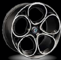
20" disky z lehkých slitin Speciale (Sprint a Veloce WRD)