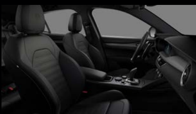
Sportovní perforovaná sedadla v černé kůži (Sprint a Veloce 473)