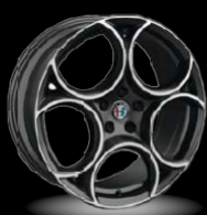
19" disky z lehkých slitin Sport (Sprint 3DY)