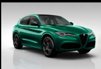
Zelená Montreal + černá střecha (6Y3-329) Pouze Tributo Italiano