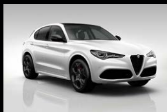
Bílá Alfa + černá střecha (0UX-122) Pouze Tributo Italiano