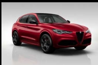
Červená Alfa + černá střecha (1CL-897) Pouze Tributo Italiano