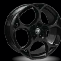
21" disky z lehkých slitin Modale (Sprint, Veloce a Tributo Italiano 3ET)