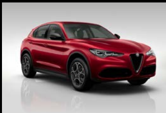
Červená Alfa (5CA-414)