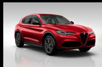
Červená Etna (5ZW-645)