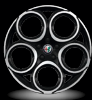
18" disky z lehkých slitin Classico Bi-Colore (Sprint WFL)