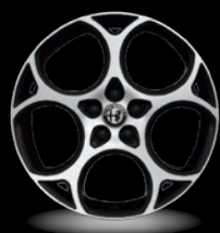
19" disky z lehkých slitin Veloce (Sprint a Veloce 1MJ)