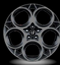
20" disky z lehkých slitin Prototipo (Veloce a Tributo Italiano 1M5)