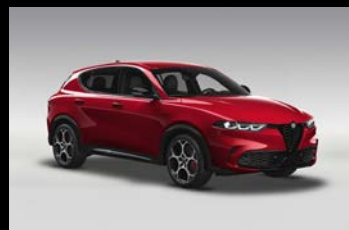
Červená Alfa (1WY-414)