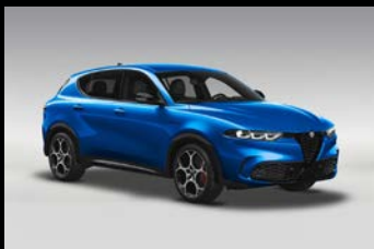
Modrá Misano (3YS-756)