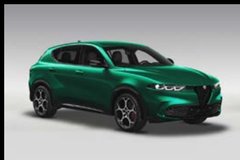
Zelená Montreal (6FW-398)