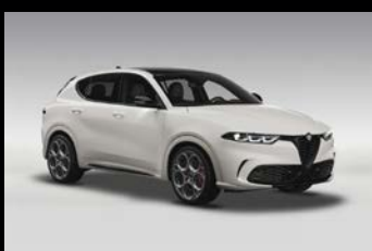
Bílá Alfa + černá střecha (0UX-222) Pouze Tributo Italiano