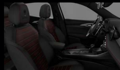
Sedadla v perforované černé kůži s červeným prošíváním a podkresem (Tributo Italiano 508)