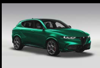
Zelená Montreal + černá střecha (6Y3-041) Pouze Tributo Italiano