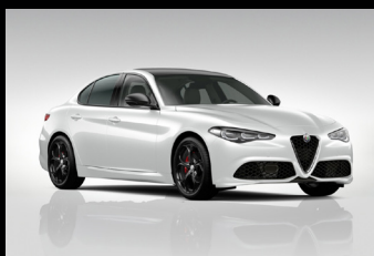
Bílá Alfa + černá střecha (0UX-122) Pouze Tributo Italiano