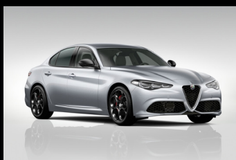
Šedá Moonlight Pearl (61Q-252)