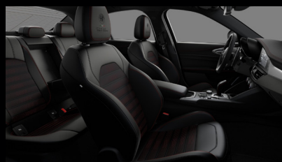
Sportovní perforovaná sedadla v černé kůži s červeným prošíváním a podkresem (Tributo Italiano 646)