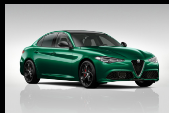
Zelená Montreal + černá střecha (6Y3-329) Pouze Tributo Italiano