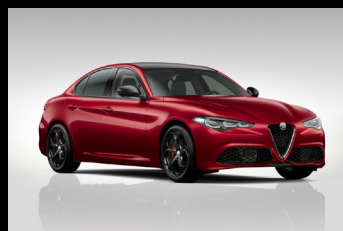
Červená Alfa + černá střecha (1CL-897) Pouze Tributo Italiano