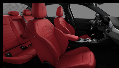
Sportovní perforovaná sedadla v červené kůži (Sprint a Veloce 557)