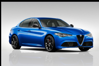
Modrá Misano (5DS-756)