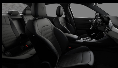
Sportovní perforovaná sedadla v černé kůži (Sprint a Veloce 473)