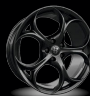
19" disky z lehkých slitin Classico (Tributo Italiano 3CV)