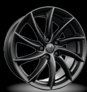
18" disky z lehkých slitin Turbine (Sprint 3Co)