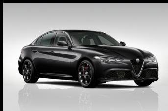
Černá Vulcano (58B-408)