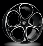
19" disky z lehkých slitin Lusso (Sprint a Veloce 3CX)