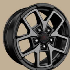
17" disky z lehkých slitin Rubicon (WFV, standard)