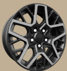
18" disky z lehkých slitin Sahara (WPA, standard)